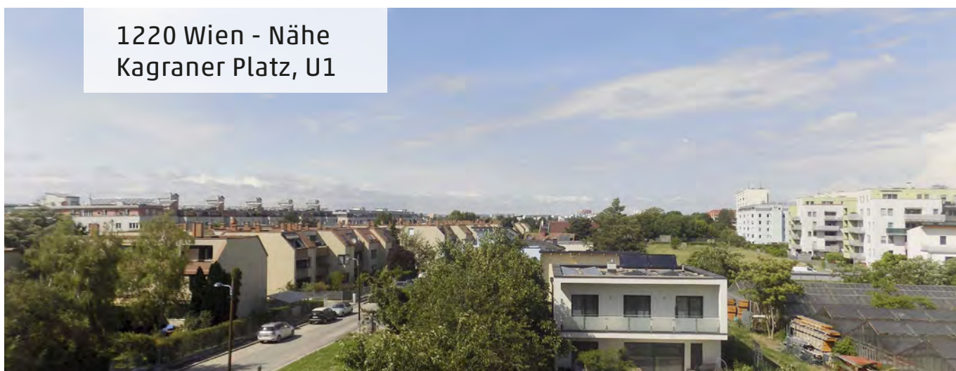
1220 Wien - Nähe Kagraner Platz, U1

Objektnummer: 2003/11241 Miete: € 2.298,48 (brutto) Fläche: ca. 147 m 2 Prov: € 6.895,44 (inkl. Ust.) HWB 171