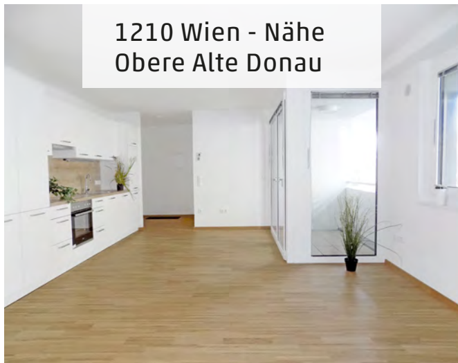
1210 Wien - Nähe Obere Alte Donau