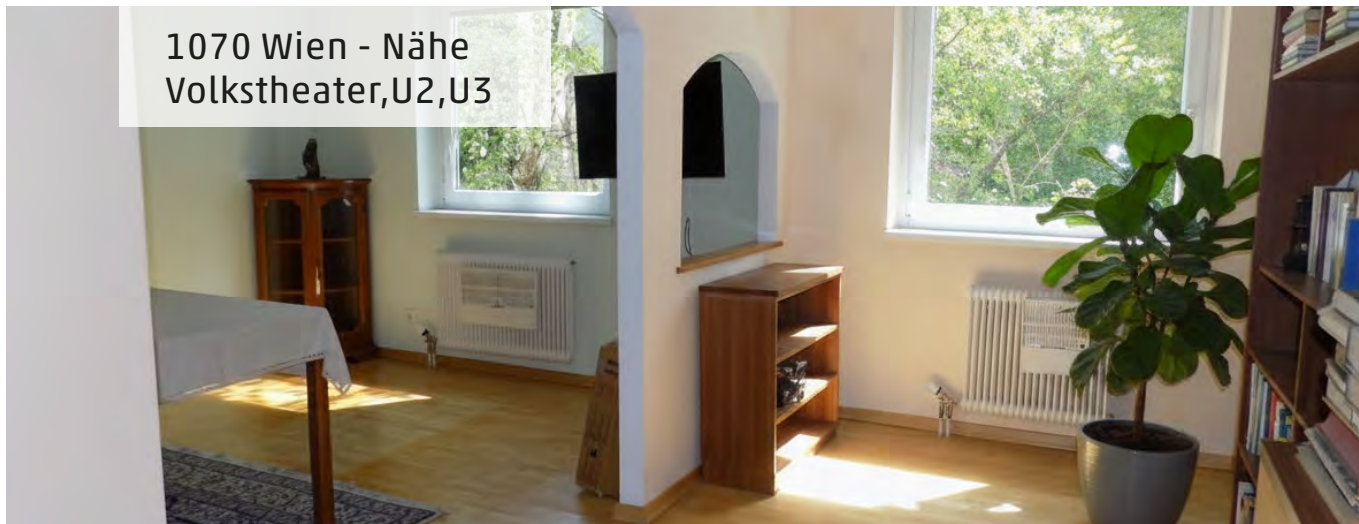
1070 Wien - Nähe Volkstheater, U2, U3