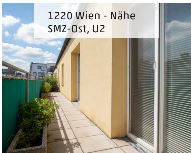
1220 Wien - Nähe SMZ-Ost, U2

Provision: ab € 16.884,- (inkl. Ust.) HWB: 67,66