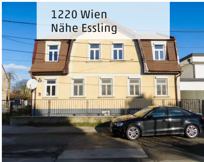
1220 Wien Nähe Essling