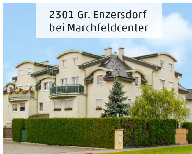
2301 Gr. Enzersdorf bei Marchfeldcenter