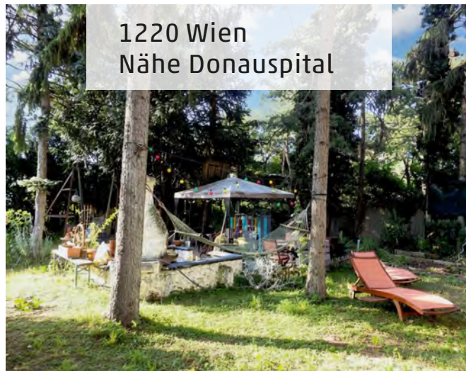
1220 Wien Nähe Donauspital

Objektnummer: 2003/11362 Kaufpreis: € 219.818,- Wohnfläche: 38 m 2 Prov. € 7.913,45 / HWB 18,94