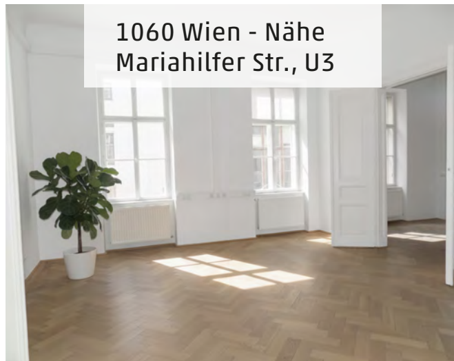
1060 Wien - Nähe Mariahilfer Str., U3

Objektnummer: 2003/11238 Miete: € 1.700 (brutto) Wohnfläche: 145 m 2 Provisionsfrei HWB 230 kWh/m 2 a