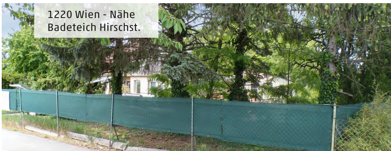
1220 Wien - Nähe Badeteich Hirschst.

Objektnummer: 2003/11220 Kaufpreis: € 499.000,- Grundfläche: 587 m 2 Provision: € 17.964,-